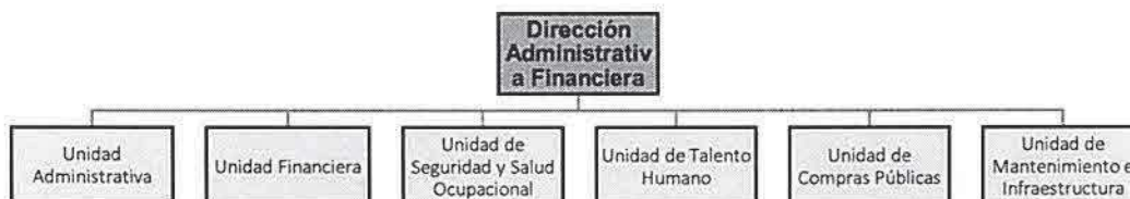
Ilustración 1. Estructura orgánica-funcional de la Dirección Administrativa Financiera