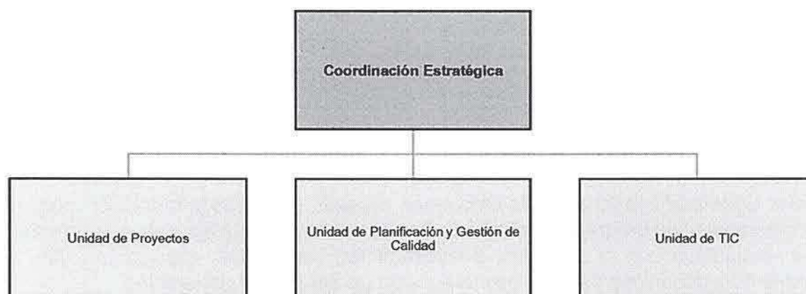
Ilustración 1. Estructura orgánica-funcional de la coordinación estratégica